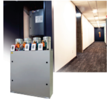
Modèle vertical illustré Modèle horizontal disponible

Le zonage intégré dans le ventilo-convecteur compact est sans contredit son plus grand avantage, permettant